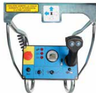
Quadro comandi sulla piattaforma semplice e intuitivo